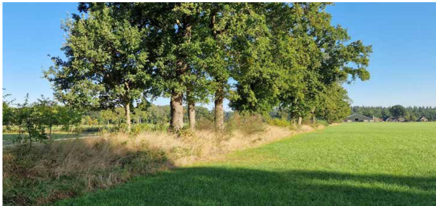
Door het afgraven van de houtwal, worden de eikenbomen verzwakt, komen ze los te staan en waaien ze bij een storm om. Hier is de houtwal goed hersteld en ziet het er weer mooi uit.

Tekst: Wiggele Oosterhoff